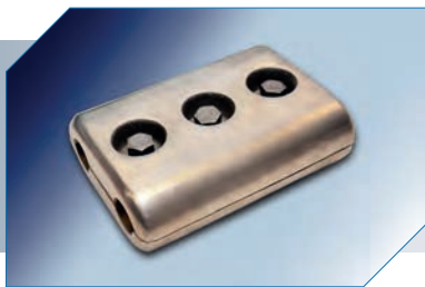
Conector Paralelo para 2 Cabos