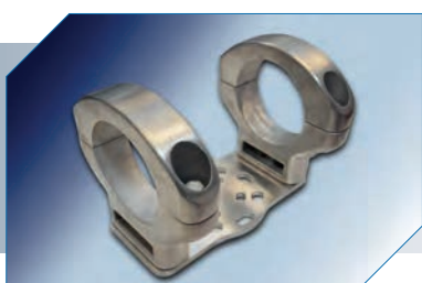
Conector Suporte Fixo/Deslizante