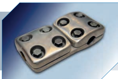
Conector de Derivação tipo "T" para 2 Cabos