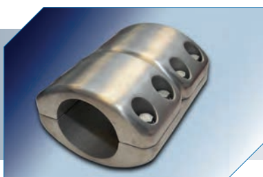
Conector Emenda Reta