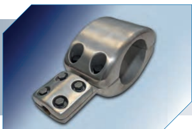
Conector de Derivação tipo "T" para Tubo-Cabo