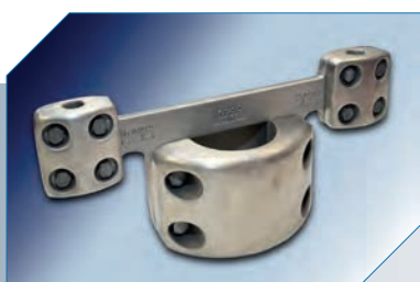
Conector de Adaptação Tubo 2 Cabos